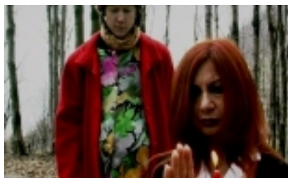
"Il bosco" di Massimo Alborghetti

IRMA ANTI, UNA DONNA DELLA RESISTENZA di Sergio Mariotti- 23'