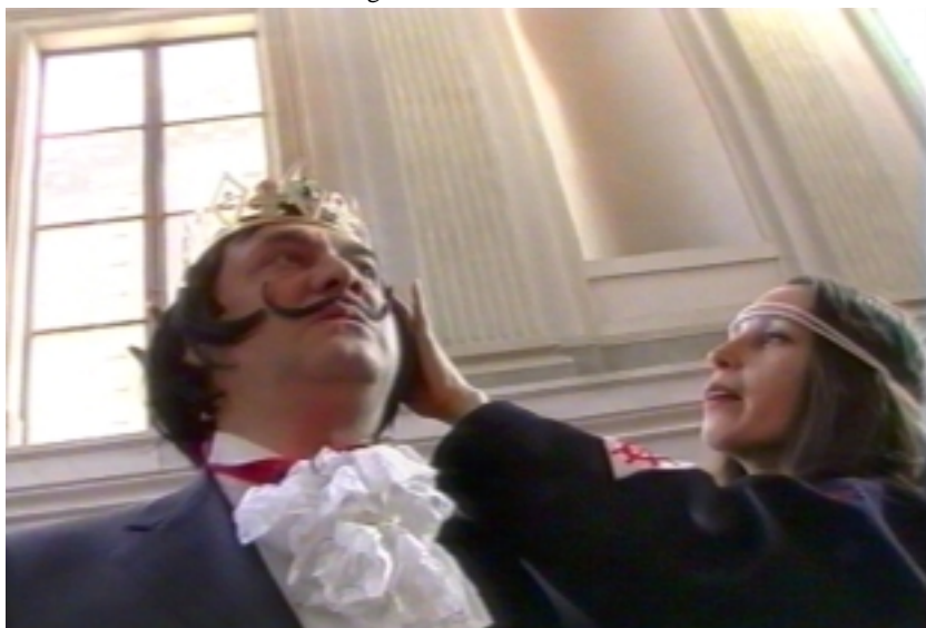
"Frutti di carne e spirito" di Maurizio Margherito