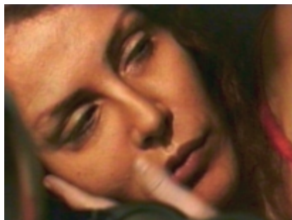
"Perle ai porci!" di Roberto Merlino